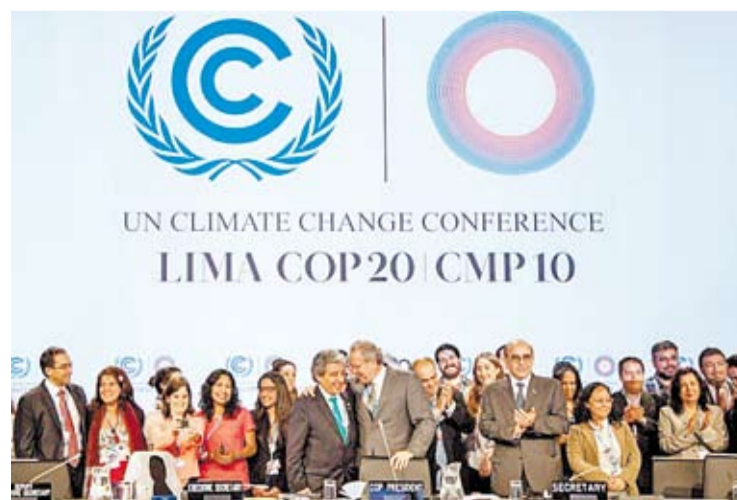
PANEL DE LA COP20, CELEBRADA EN LIMA EL AÑO PASADO.

dad histórica para alcanzar un acuerdo global con compromisos legalmente vinculantes en materia de mitigación”, y destacaron que la propuesta que el país presente en estos meses deberá ser implementada a lo largo de varios periodos presidenciales, dada su extensión temporal. Es por ello que desde la coalición de ONGs subrayan la importancia de un proceso de consulta y contribuciones de parte de la sociedad civil, el sector empresarial, académico y de la órbita política, y piden que su cumplimiento sea garantizado por toda la sociedad.