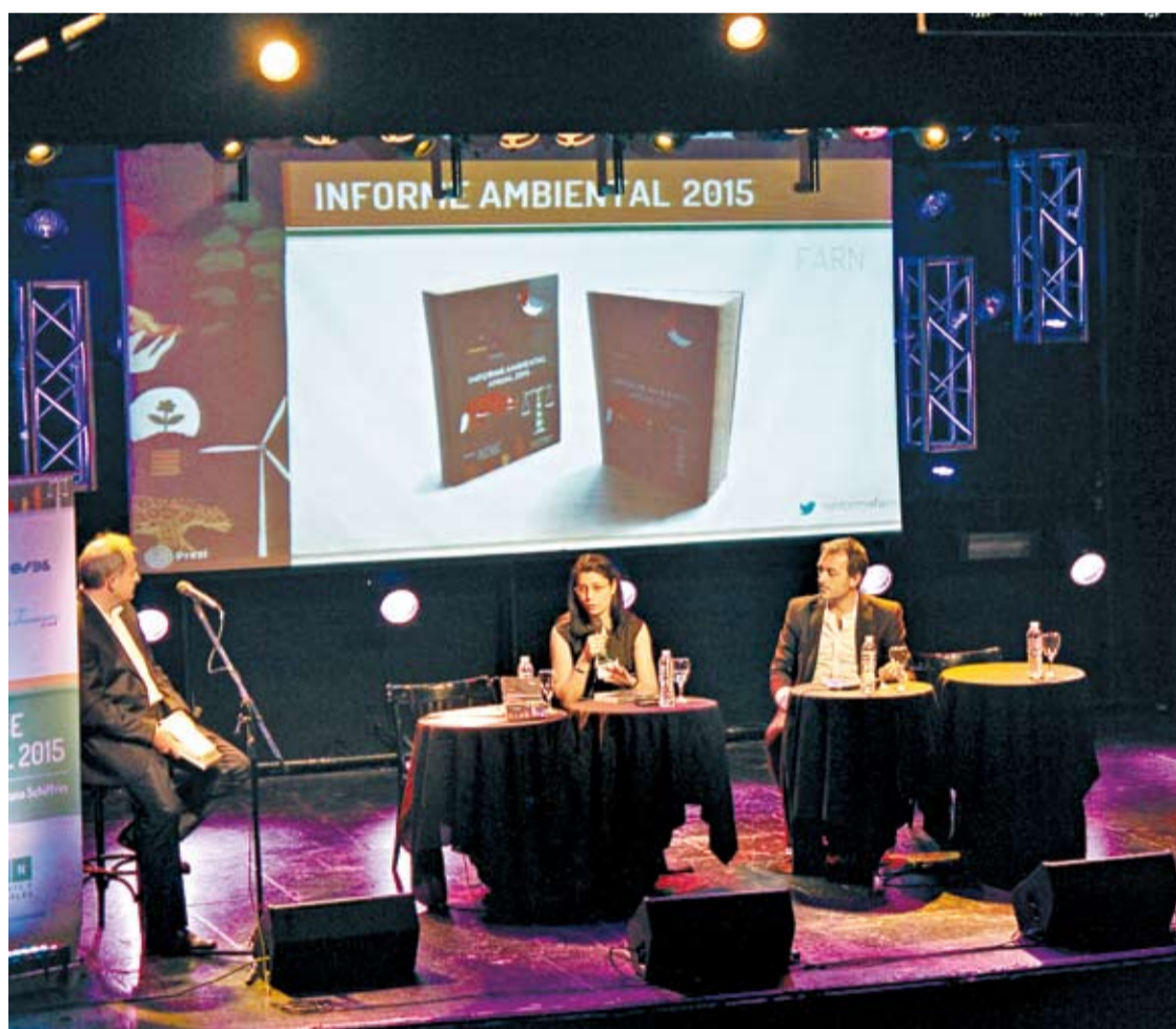
REFERENTES DE FARN, DURANTE LA PRESENTACIÓN DEL INFORME.